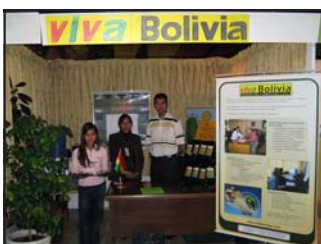
Nuestro equipo en una conferencia

Estamos muy agradecidos por la oportunidad de haber servido en Bolivia y alabamos a Dios por permitirnos ser parte de la labor que EL está haciendo en Bolivia.