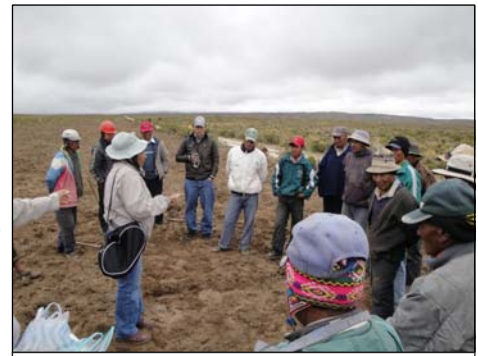
Agrónomo dando instrucciones en la siembra de quinua.

Su equipo está trabajando para ayudar a mejorar la dieta de las personas viviendo en sus comunidades a través de mejores prácticas agrícolas y por la utilización de