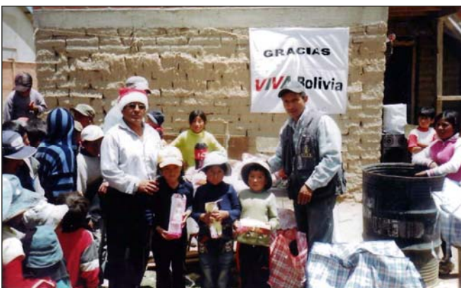
Algunos de los 225 niños que recibieron regalos la navidad pasada gracias a SIAB