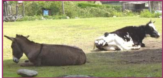
To venner: esel og kua

Før vi gikk rundt i Incachaca, hadde vi en liten orientering om hvordan og hvorfor vi skulle holde oss i sammen. Det var mange dyr som syntes om om vårt selskap. De lot seg bli fotogarefert!