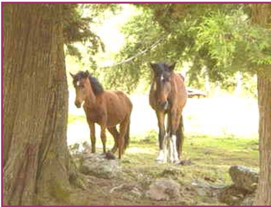
To skjønn hester.