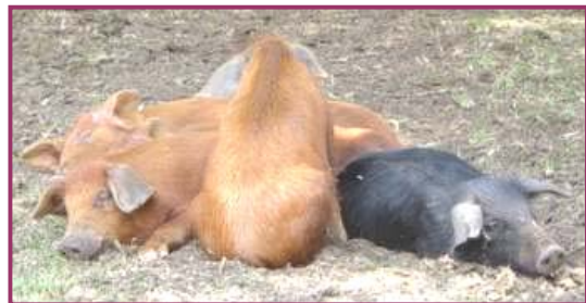
Nif, Naf, Nuf og en til

Et nydelig "Valle Hermoso" familiebilde!