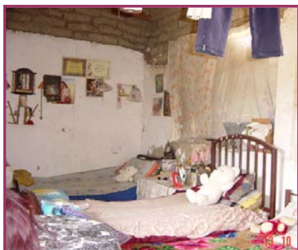
Her sover hele familien på 5 mennesker i tre senger på et rom.

Etter besøket så vi at de fleste av barna kommer fra hjem som er bygd av leire og i beste fall med et tak av bølgeblikk. Derfor etter det vi så, har barna det veldig godt på VH!