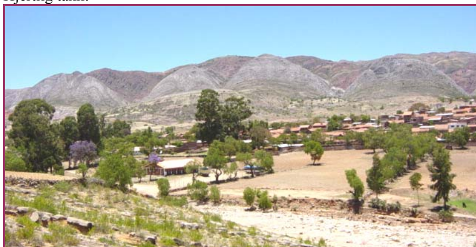
Et landskaps-bilde fra Toro Toro.