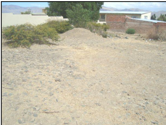
Dette er tomten vår, rett ved siden av VH!

Vi ønsker derfor å fortsette å "bygge Guds rike", og har nylig kjøpt den nye "tomta". "Papirmølla" er under arbeid, men vi regner med at den er vår før jul i år. Opprinnelig så vil eierne ha 200 000 kroner, men solgte den til oss for 90.000 kroner. Gud er god! Vi har foreløpig bare betalt depositum.